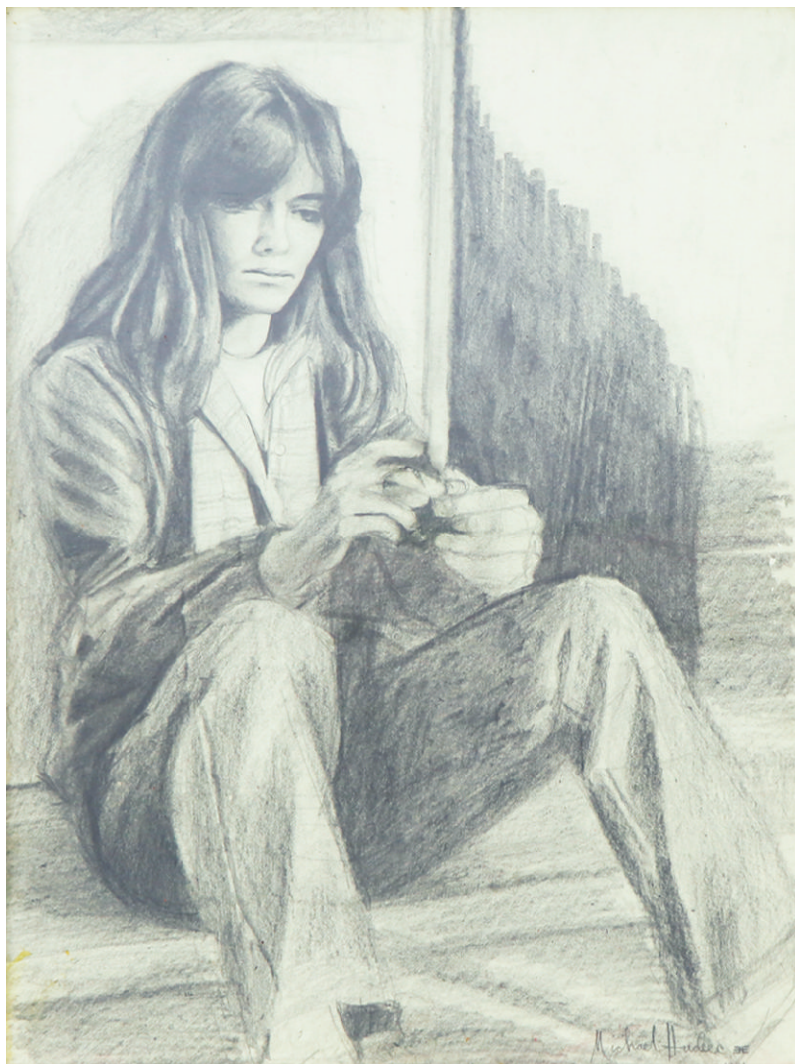
Sem Título Untitled Grafite sobre papel Graphite on paper 25,5 x 34 cm | 1981