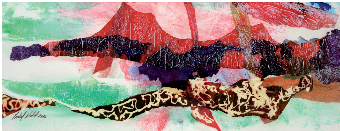
Toureiro | Bullfighter 86 x 50 cm