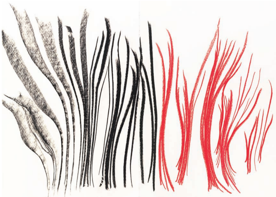
Sem título I | Untitled I Pastel sobre papel | Pastel on paper 140 x 100 cm | 2011