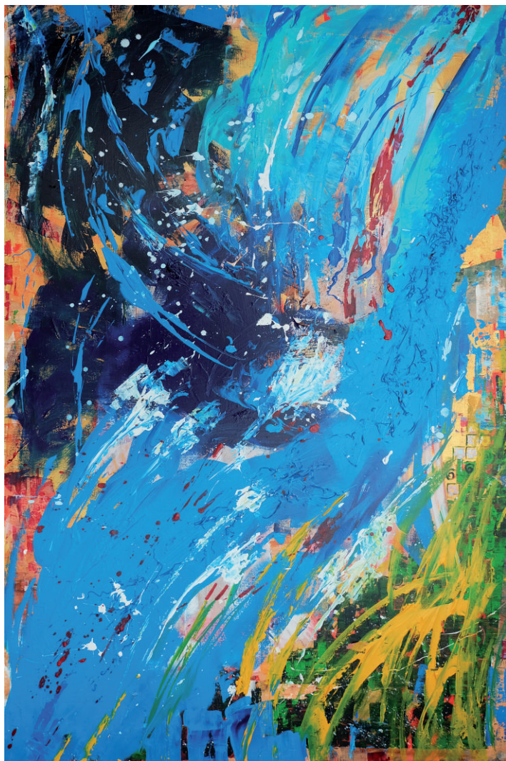
Jardim do tempo Time garden Acrílico sobre tela Acrylic on canvas 80 x 120 cm | 2016 Coleção Privada Private Collection