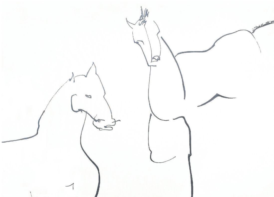
Cavalos Brancos | White horses 140 x 100 cm