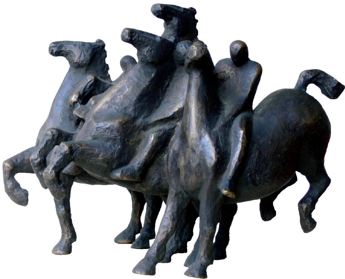
Apocalipse II Bronze 18 x 22 x 18 cm | 2010