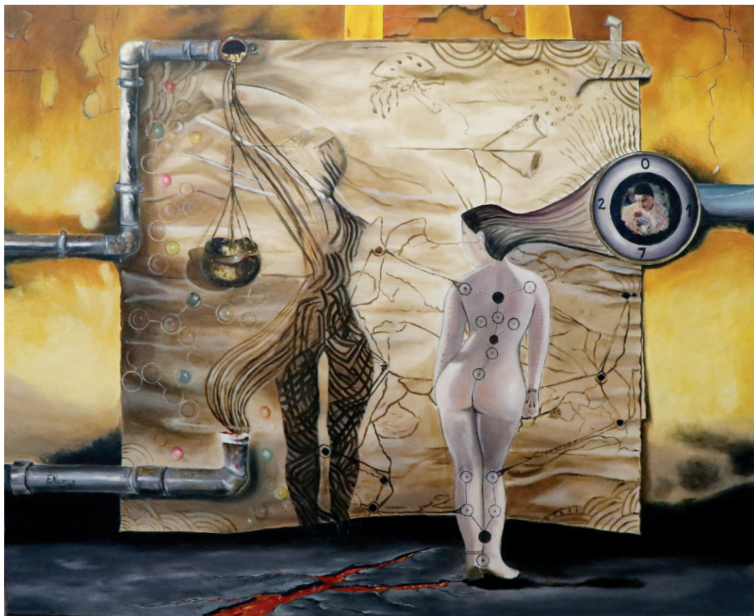
Rosalva Óleo sobre tela | Oil on canvas 180 x 146 cm | 2017