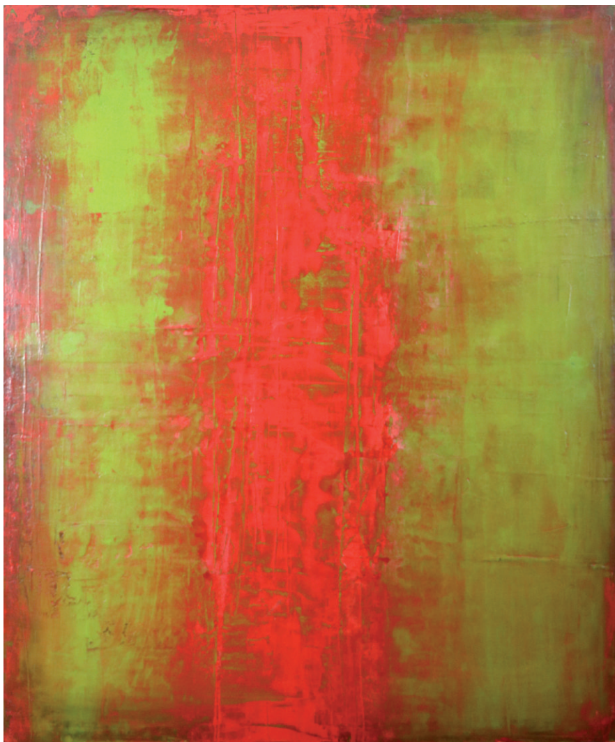
Sem Título I Untitled I 100 x 120 cm