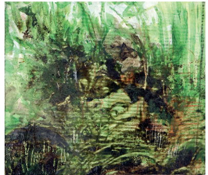
Meditação Meditation Técnica Mista sobre tela Mixed technique on canvas 3 x (37 x 32 cm) | 2016