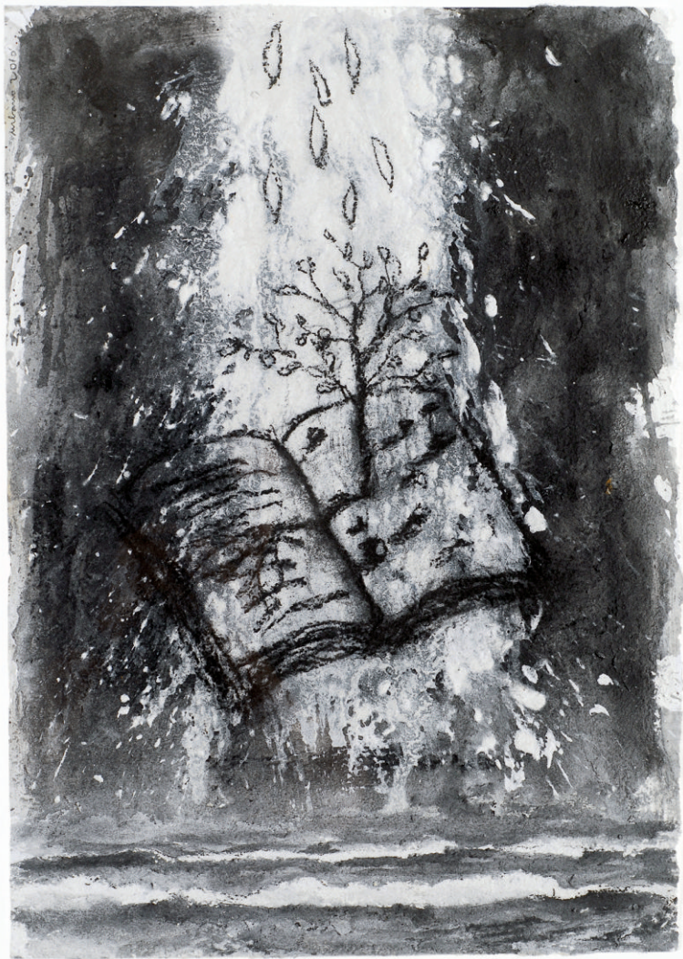
O Fundo das Naus The Bottom of the Ships Técnica mista sobre papel Mixed technique on paper 43 x 60,5 cm | 2010 Coleção Privada Private Collection