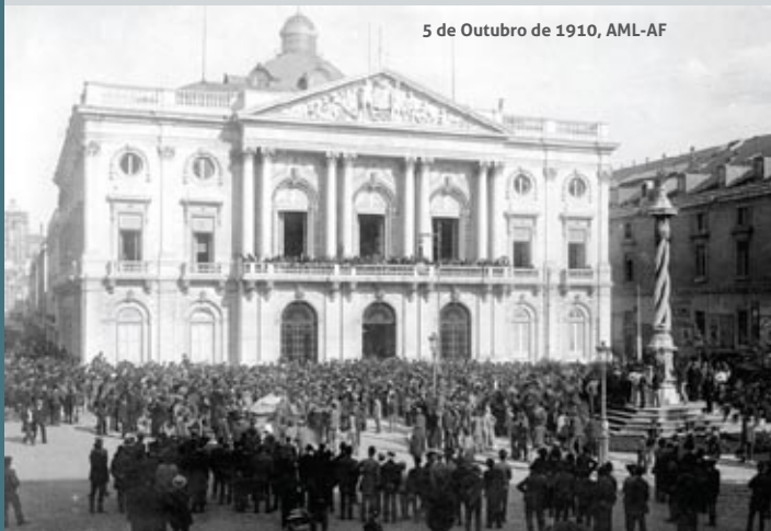
5 de Outubro de 1910

Na Região Autónoma da Madeira, decorrem diversas iniciativas, de entre as quais se destaca o projecto do Centro de Estudos de História do Atlântico «República e Republicanos na Madeira: 1880-1926», que inclui um seminário dedicado à temática e dividido em cinco áreas de intervenção: Política e Instituições; Economia; Sociedade e Quotidiano; Cultura, Arte e Património, e História da Ciência e da Técnica.