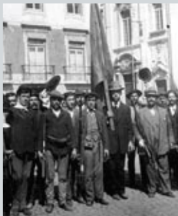
5 de Outubro de 1910

No próximo dia 5 de Outubro assinala-se a passagem de 100 anos sobre a Implantação da República Portuguesa. Uma ocasião carregada de simbolismo, em que são evocadas as razões e objectivos da implementação de um novo regime político, em que as aspirações a um país mais justo e igualitário deixaram para trás uma monarquia desgastada e ultrapassada.